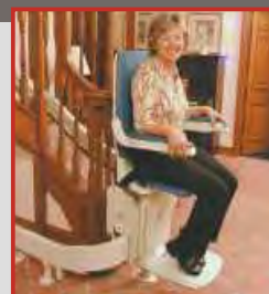
Sedačkový výťah Bison