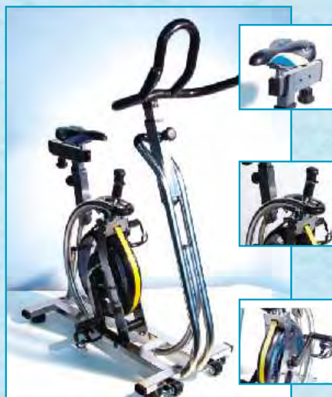
hydrobike NAUTILUS pre rehabilitačné použitie

Pohyb vo vode je príjemnou a nesmierne prospešnou činnosťou pre ľudský organizmus, uvoľňuje sa svalové napätie, svalstvo sa prekrvuje, zlepšuje sa jeho pružnosť a súčinnosť.