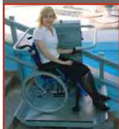
Šikmá schodisková plošina SP 150 Omega